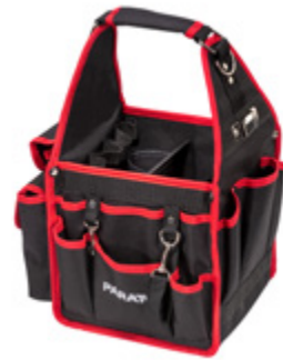
BASIC TOOL SOFTBAG S