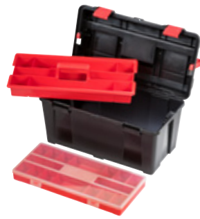
PROFI-LINE ALLROUND M