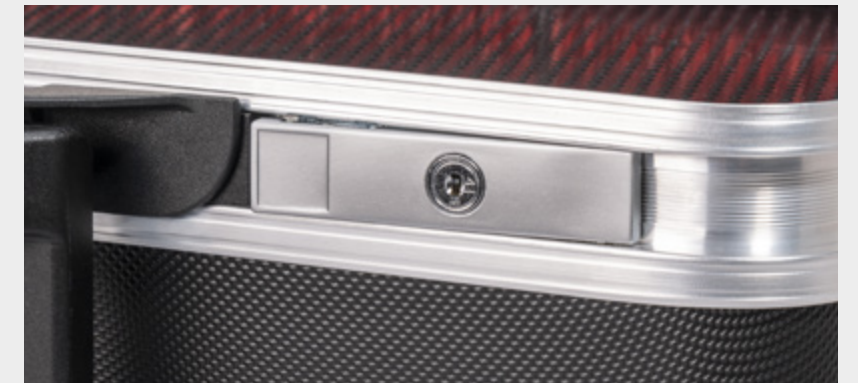
KIPPZYLINDERSCHLOSS, STANDARDMÄSSIG VERBAUT BARREL LOCK, FITTED AS STANDARD