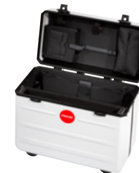
PARADOC TRONX WHITE