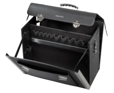
NEW CLASSIC KINGSIZE PLUS