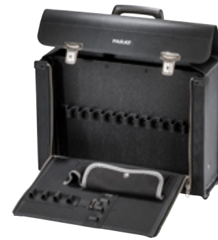
NEW CLASSIC PLUS