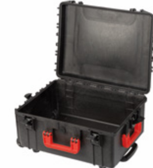
PROTECT 53 ROLL