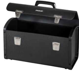
NEW CLASSIC INDIVIDUAL M