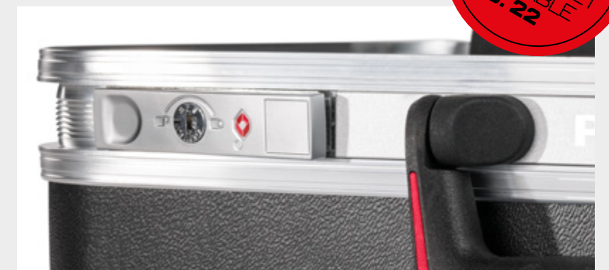
TSA LOCK™, FÜR SICHERHEITSKONTROLLEN VON BEHÖRDEN TSA LOCK™, FOR SECURITY CHECKS BY AUTHORITIES

NACH- RÜST-SETS ERHÄLTlich RETROFIT SET AVAILABLE S. 22