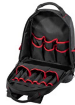
BASIC BACK PACK