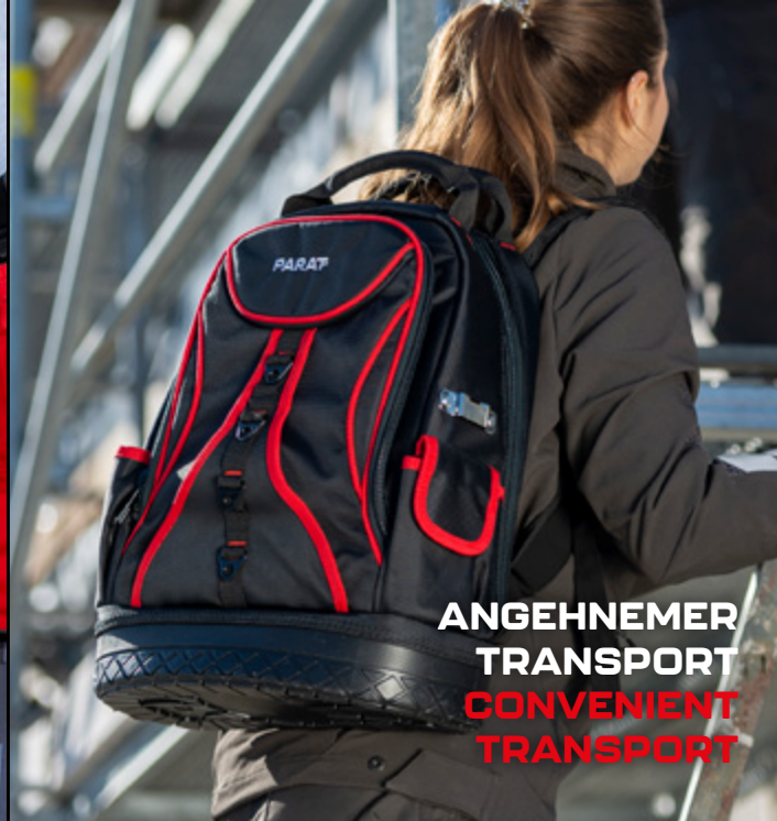
ANGEHNER TRANSPORT CONVENIENT TRANSPORT