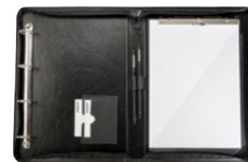
PARADOC SCHREIBMAPPE WRITING CASE