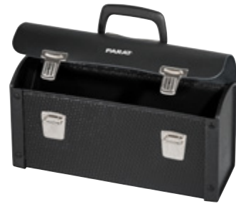
NEW CLASSIC INDIVIDUAL S