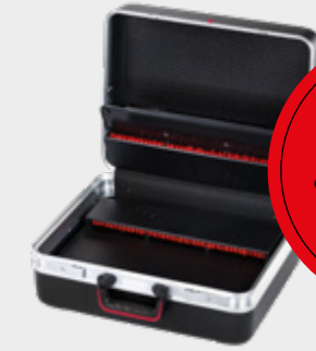
CLASSIC KINGSIZE POWER CP-7