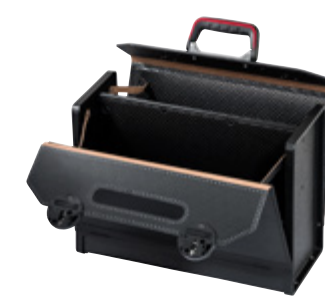
TOP-LINE PLUS CP-7