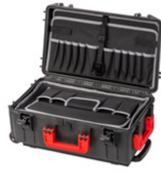
PROTECT 30-S ROLL