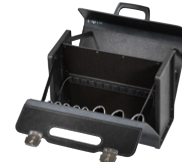
NEW CLASSIC PLUS & VIEW