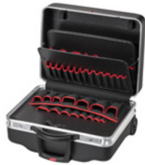
CLASSIC KINGSIZE ROLL NEO