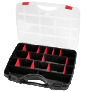
PROFI-LINE ORGANIZE M