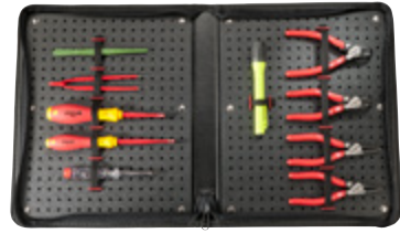
BASIC PORTFOLIO CASE