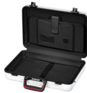
PARADOC ATTACHÉ WHITE