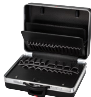
CLASSIC KINGSIZE PLUS ROLL

Material material X-ABS-Kunststoff X-ABS plastic | Aluminium | Con-Pearl®