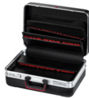
CLASSIC PLUS CP-7