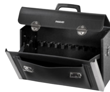
NEW CLASSIC ALLROUND