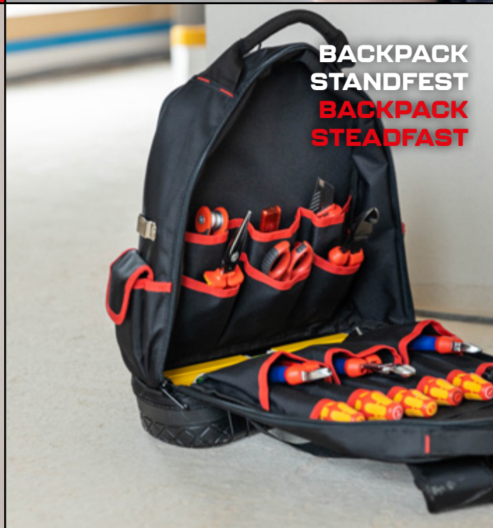
BACKPACK STANDFEST BACKPACK STEADFAST