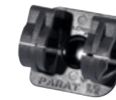
PARASNAP® LIGHT-HOLDER SNAP-IN 2