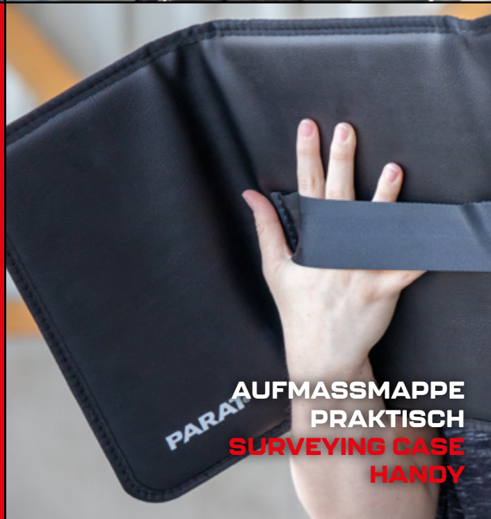
AUFMASSMAPPE PRAKTISCH SURVEYING CASE HANDY