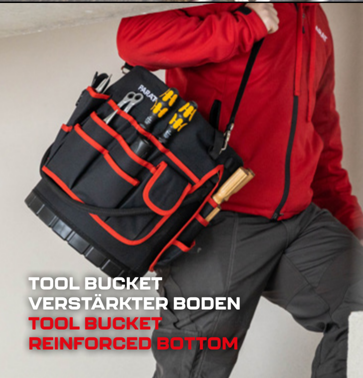
TOOL BUCKET VERSTÄRKTER BODEN TOOL BUCKET REINFORCED BOTTOM