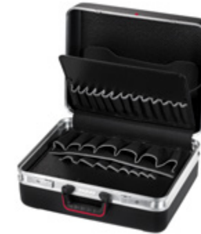
CLASSIC DEEP SPACE

MEIN KOFFER IMMER PARAT. MY CASE ALWAYS PARAT.