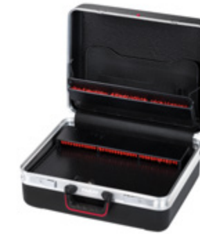
CLASSIC DEEP SPACE CP-7