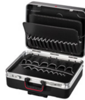
SILVER KINGSIZE ROLL