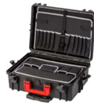
PROTECT 34-S ROLL