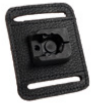
PARASNAP® BELT BRACKET BASE