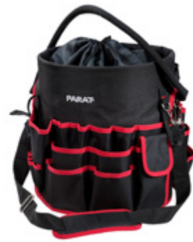
BASIC TOOL BUCKET