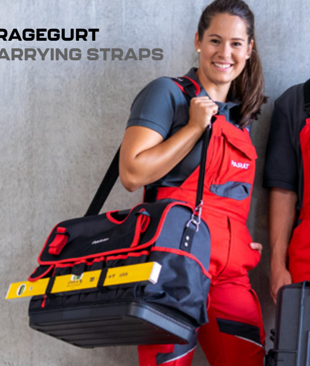
TRAGEGURT CARRYING STRAPS