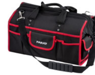
BASIC TOOL SOFTBAG M