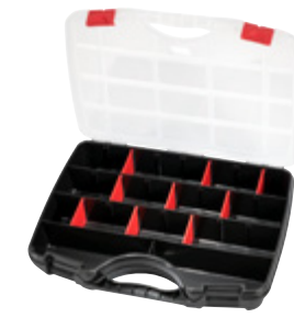
PROFI-LINE ORGANIZE S