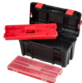
PROFI-LINE ALLROUND XL