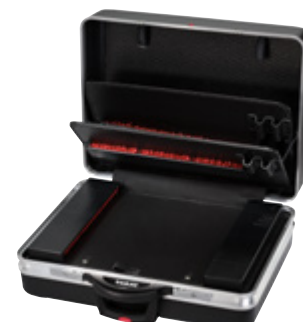
CLASSIC KINGSIZE PLUS ROLL CP-7

Material material X-ABS-Kunststoff X-ABS plastic | Aluminium | Con-Pearl®