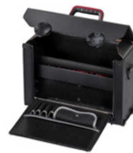
TOP-LINE ALLROUND CP-7