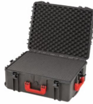
PROTECT 71-F ROLL