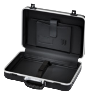
PARADOC ATTACHÉ BLACK