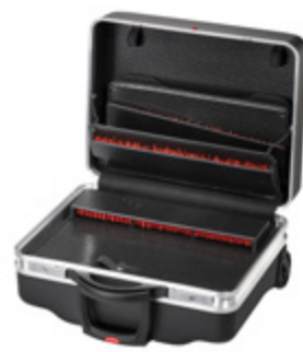
CLASSIC KINGSIZE ROLL NEO CP-7

Material material X-ABS-Kunststoff X-ABS plastic | Aluminium | Con-Pearl®