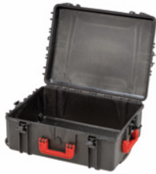
PROTECT 71 ROLL