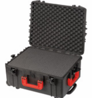
PROTECT 53-F ROLL