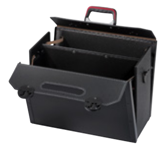
TOP-LINE KINGSIZE CP-7