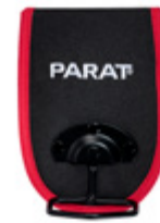
PARABELT HAMMER HOLDER