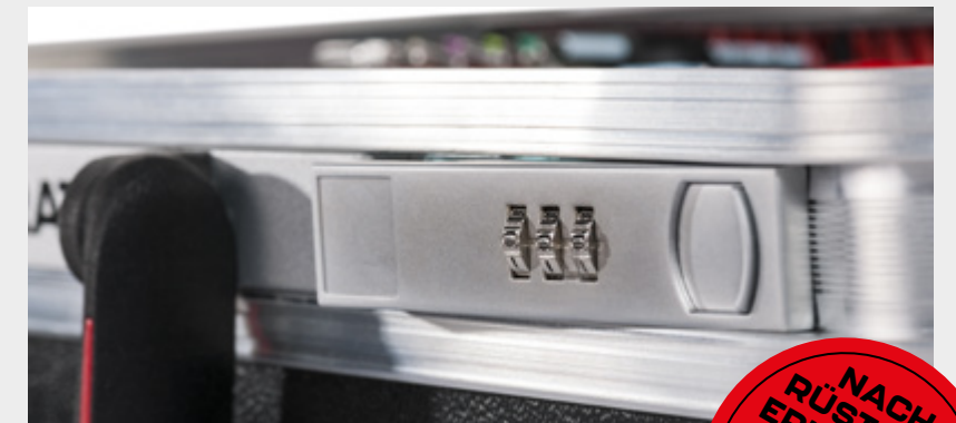
ZAHLENSCHLOSS "SAFE" COMBINATIONS LOCK "SAFE"

NACH- RÜST-SETS ERHÄLTlich RETROFIT SET AVAILABLE S. 22