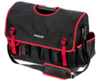
BASIC TOOL SOFTBAG L