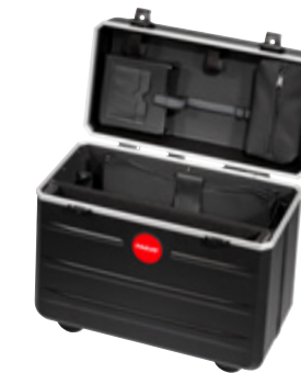
PARADOC TRONX BLACK