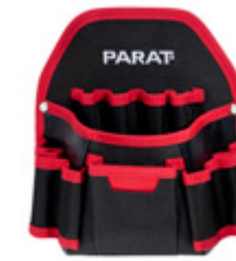
PARABELT NAIL POCKET