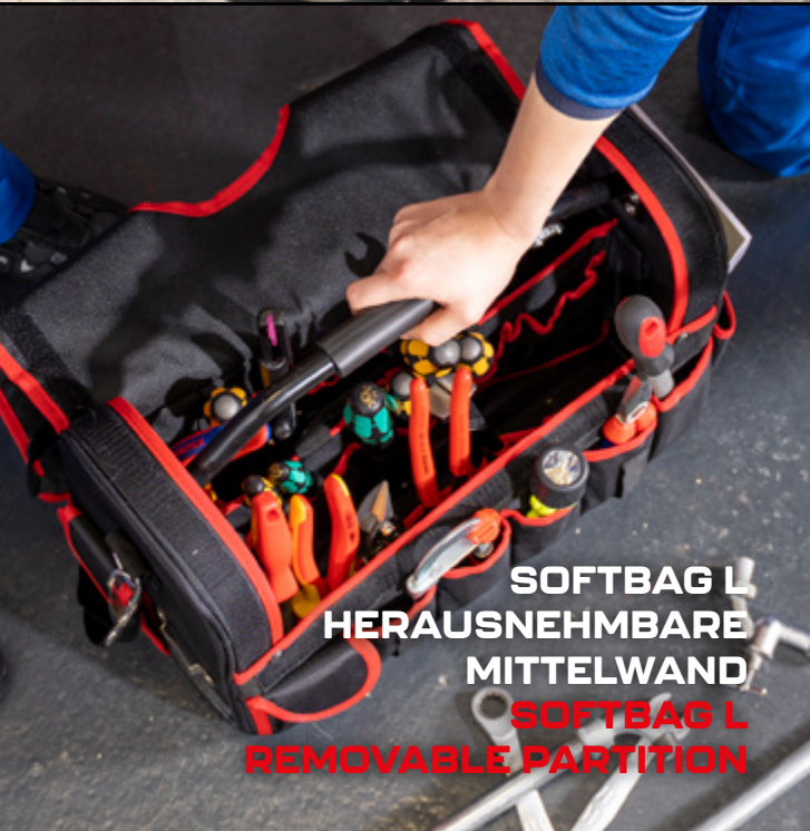
SOFTBAG L HERAUSNEHMBARE MITTELWAND SOFTBAG L REMOVABLE PARTITION

Whether you are looking for a practical accessory or a useful spare part - visit our website and find the right extension thanks to our search filter (page 22).