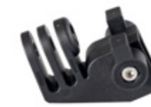
PARASNAP® SNAP-IN CAM