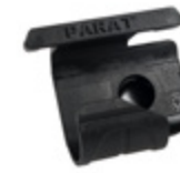
PARASNAP® LIGHT-HOLDER SNAP-IN 1