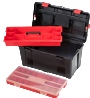
PROFI-LINE ALLROUND L